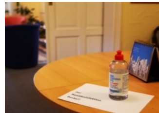
Hygienekonzept in den Beratungsstellen

Beispiel, im Hinblick auf eine Ansteckung auf diese Weise sicherer fühlten. In einem Fall litt eine Ratsuchende unter massiver Schwangerschaftsübelkeit. Mit der Videoberatung konnte sie die Beratung in ihrem gewohnten Umfeld wahrnehmen und, wenn notwendig, die Beratung unterbrechen. Eine Beratung mit Maske wäre für diese Frau kaum möglich gewesen.