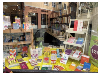
Schaufenstergestaltung der „Altstädter Buchhandlung“ zum 150jährigen Bestehen des § 218

Zum 150 jährigen Bestehen des § 218 fand in Zusammenarbeit mit der pro familia Osnabrück und der Diakonie ein gemeinsames Radiointerview und ein Interview mit der Neuen Osnabrücker Zeitung zum Thema statt. Zwei Buchhandlungen in Osnabrück dekorierten zur Woche um den Jahrestag je ein Schaufenster mit Literatur zum Thema, das in den Buchhandlungen zu spontanen Diskussionen führte.