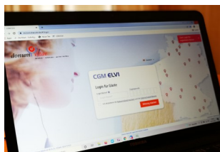
Neuer Startbildschirm ELVI