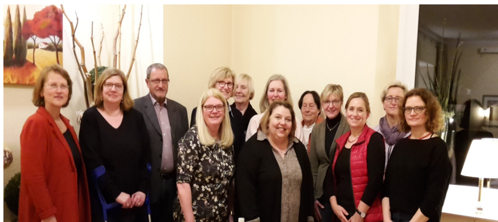
Jahrestreffen der Mitarbeiterinnen, des Vorstandes und des Fachteams des donum vitae Regionalvereins Stadt und Landkreis Osnabrück e. V.

DONNERSTAG 9.00 BIS 12.00 UHR 14.00 BIS 17.00 UHR