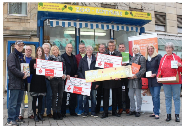
Eröffnung der Zoolotterie Osnabrück 2018

In den Arbeitskreisen der Schwangerenberatungsstellen, der Frühen Hilfen und im Frauenforum werden diese Fragen immer wieder erörtert. Die Politik ist gefordert, den besonderen Schutz der Familie umzusetzen.