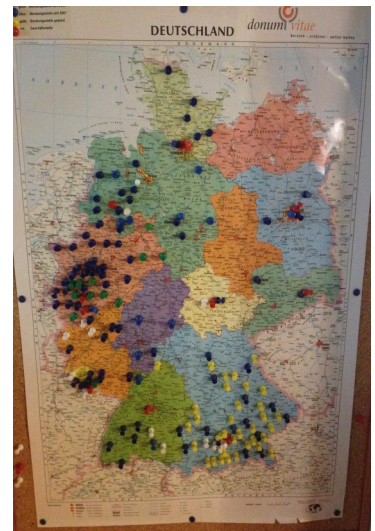
210 donum vitae Beratungsstellen in Deutschland

Im Jahr 2012 hat die Onlineberatung den Dienstanbieter gewechselt und die Seite für mobile Endgeräte angepasst. Seit dieser Umstellung sind vom Onlineteam über 9.000 Anfragen beantwortet worden.