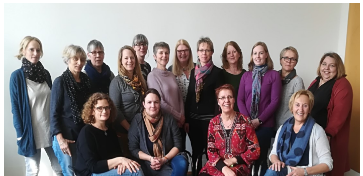
Fachtag der donum vitae Beraterinnen aus Niedersachsen am 06.03.2018 in Osnabrück