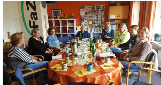
Treffen der Gruppe „Frühe Hilfen“

Termine für solche Beratungen haben hin und wieder etwas von einer Wundertüte: Es ist nicht abzusehen was kommt.