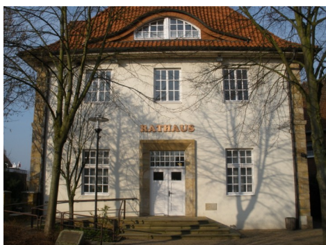
Die Beratungsstelle in Bohmte befindet sich zentral im Rathaus der Stadt.