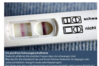
Ein positiver Schwangerschaftstest Dadurch erfahren die meisten Frauen, dass sie schwanger sind. Was das für die einzelne Frau und ihren Partner bedeutet ist dagegen sehr unterschiedlich: riesige Freude oder Katastrophe. Bei allem was dazu und dazwischen an Fragen versteht sich unsere Arbeit an!

Wir begannen unsere Präsentation mit einem Bild eines positiven Schwangerschaftstests, also mit dem, womit eine Schwangerschaft in der Regel in das Bewusstsein von werdenden Müttern und Vä-